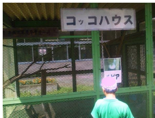
飼育舎外からの景色

また、飼育舎は往々にして校舎から離れていたり、校庭の端に位置しています。子供達との距離を短くする工夫(お昼休みに中庭に出す、飼育舎内でのふれあいを多くする、飼育舎前でのふれあいイベント開催など)をされると良いでしょう。