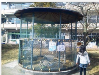
冬囲いをした飼育舎(佐野市内)