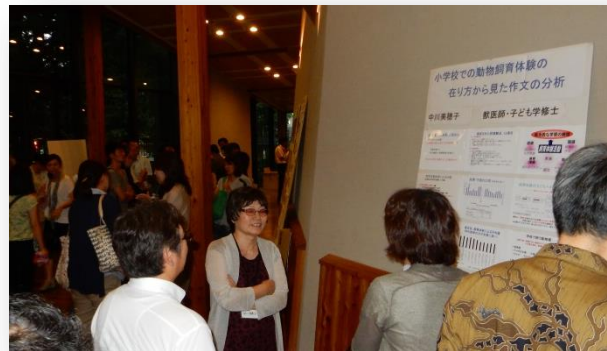
中川先生のパネル発表の光景

ポスター発表では、企業と連携した動物飼育の事例、不登校の児童へのモルモット飼育を用いた支援や学校獣医師制度の紹介などがされました。