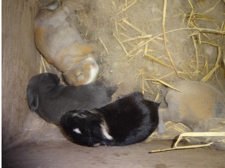
小山市の小学校で撮影