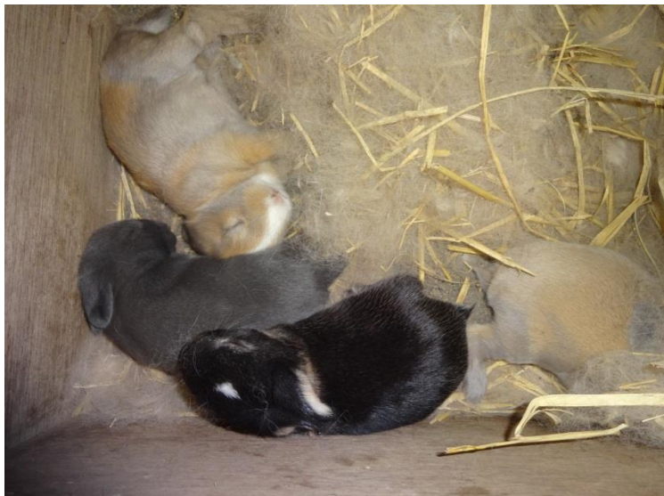
小山市の小学校で撮影