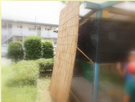
遮光ネットとヨシズ併設例