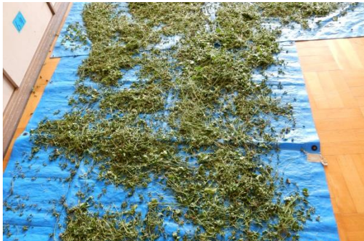
小山市の小学校で作っている乾燥牧草（クローバー）

栃木県獣医師会ホームページ： http://www.tochigi-vet.or.jp/